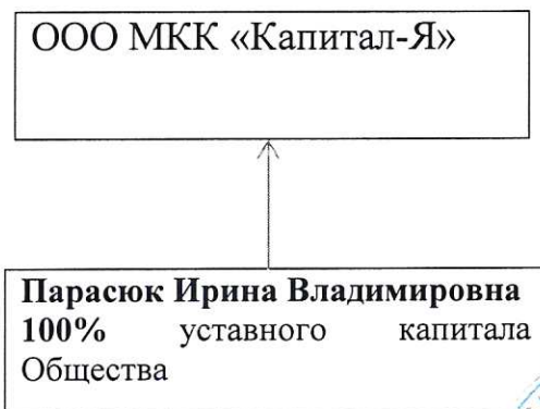
Схема взаимосвязей МКК и лиц, оказывающих существенное (прямое или косвенное) влияние на решения, принимаемые органами управления МКК